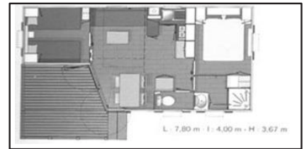
L. 7,80 m - l. 4,00 m - H. 3,67 m 7,80 x 4,00 - 4 personnes